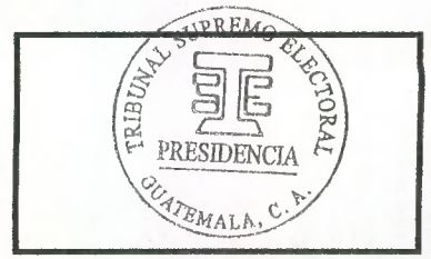
Sello de la Dependencia que presta servicios